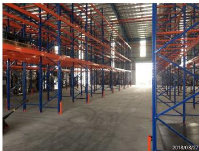
CFSターミナル倉庫内の様子

また、そのCFSターミナルは、税関ビルの真横に位置しており、屋根付きの倉庫となっているため、多くの企業が屋外でバンニングを行っている中、エアイテイーで取り扱う荷物は、倉庫内でバンニングを行えるため、雨・風・ほこりからお客様の大切な荷物を守り、保管することが可能です。